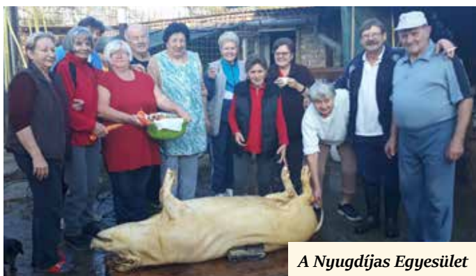
A Nyugdíjas Egyesület