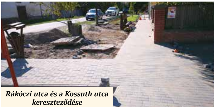
Rákóczi utca és a Kossuth utca kereszteződése