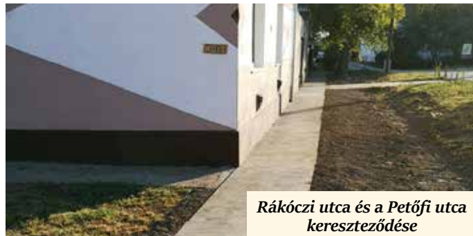
Rákóczi utca és a Petőfi utca kereszteződése